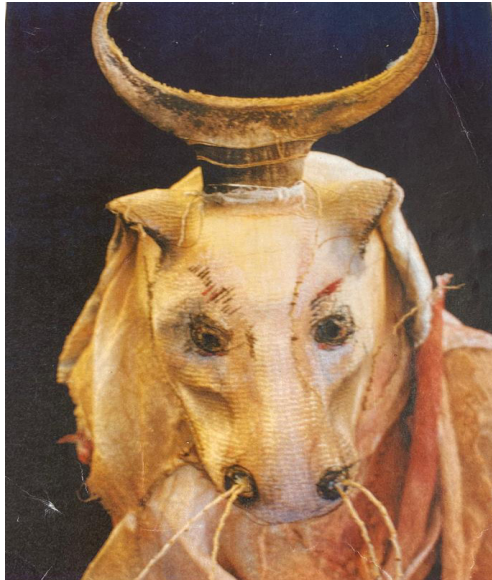
Figura 2 – Máscara da cena performática Antropozoo

http://asascenograficas.blogspot.com/p/mascaras-e-bonecos.html