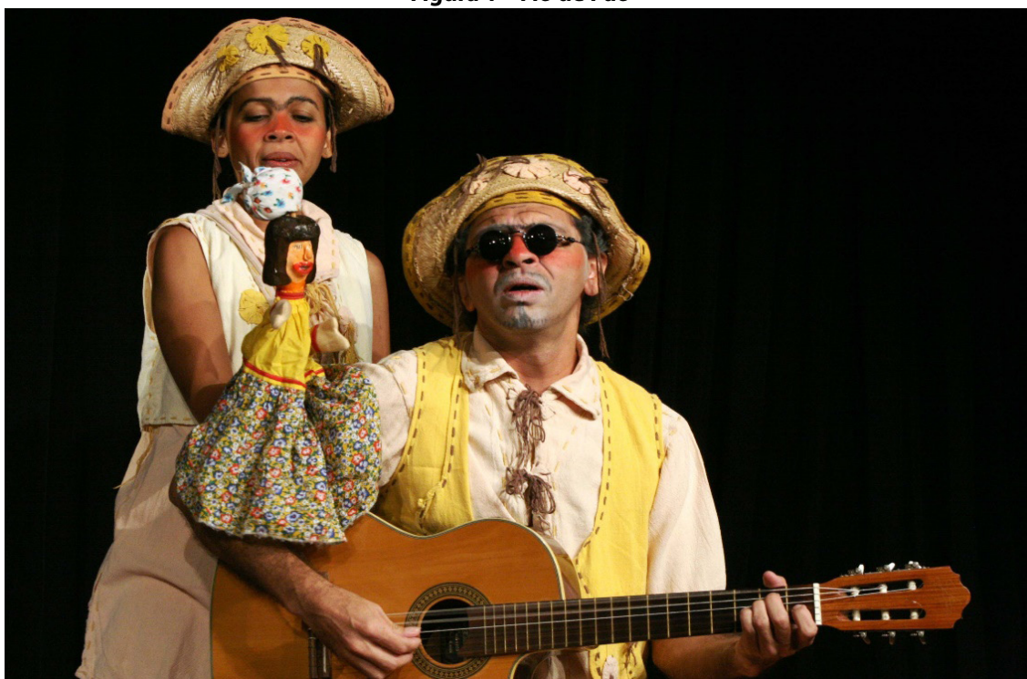
Figura 1 – Fio de Pão

O ato de conceber uma escritura para o Teatro com Bonecos tem sido uma prática de constante construção e aprendizagem, um devir, como um movimento elíptico, formado por ciclos que constituem uma trajetória com rastros do exercício de criação. Eles vão forjando a habilidade de conceber não só os produtos da criação – as dramaturgias, mas também metodologias (caminhos) para a criação de modos de produzir para o Teatro com Bonecos. Desse modo, o processo de tecer dramaturgias torna-se, a cada escritura, uma prática que germina procedimentos.