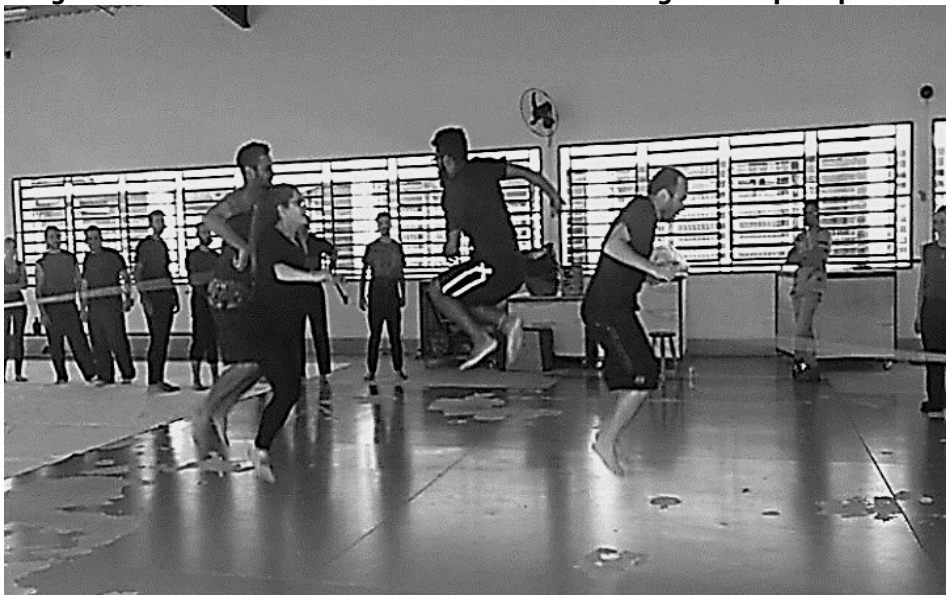
Figura 2 – Cia. Teatral Controvérsias de Pindamonhangaba

Alcançado um estado mais sensível através do ludismo que outorga a presença de um corpo “ser-criança”, a tendência é que o ambiente seja irradiado por essa potência, instaura-se um espaço de confiabilidade que seja facilitador para se posicionar diante do desejo e do prazer. Relacionar-se com outros corpos; brincar, jogar. Preparar-se para ouvir mais que agir, impregnar-se de vida. E neste transbordo de sensações vivenciadas, o famoso verso de Rimbaud, “O Eu é um outro”, aqui pode ser empregado