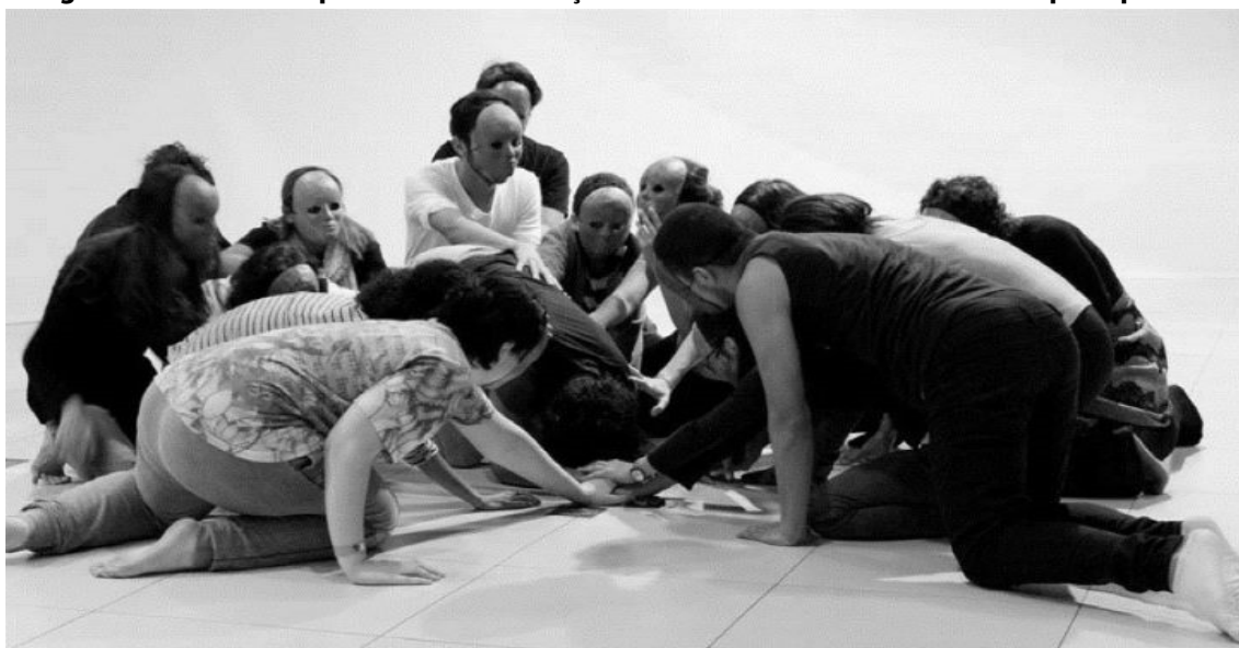
Figura 4 – Dinâmica a partir da neutralização da face - SESC- V. Mariana- SP- arquivo pessoal

Costumo nomear a dinâmica de “neutralização da face” e a máscara, “outra face”, pois que o material e a forma são distintos da réplica originalmente concebida. Utilizo desde uma touca conhecida como “ nero ” de nylon , um envelope de papel kraft , ou ainda uma máscara de cartapesta (empapelamento). O importante são os objetivos que a máscara inexpressiva estimula reproduzir, inaugurando um novo modo de representar.