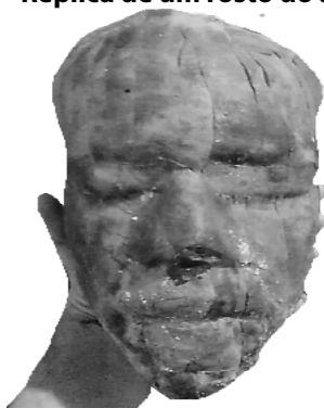
Figura 1 – Réplica de um rosto do ator “Abdon Rios”

É deste referencial histórico artístico que me inspiro e extraio a materialidade para organizar um treinamento artístico, sem a pretensão de impor verdades absolutas, mas aumentar a lucidez de múltiplas possibilidades de tornar o corpo atuante mais receptivo e disponível ao jogo cênico.