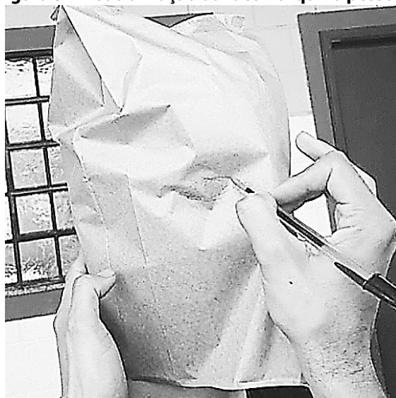
Figura 3 – Neutralização da face