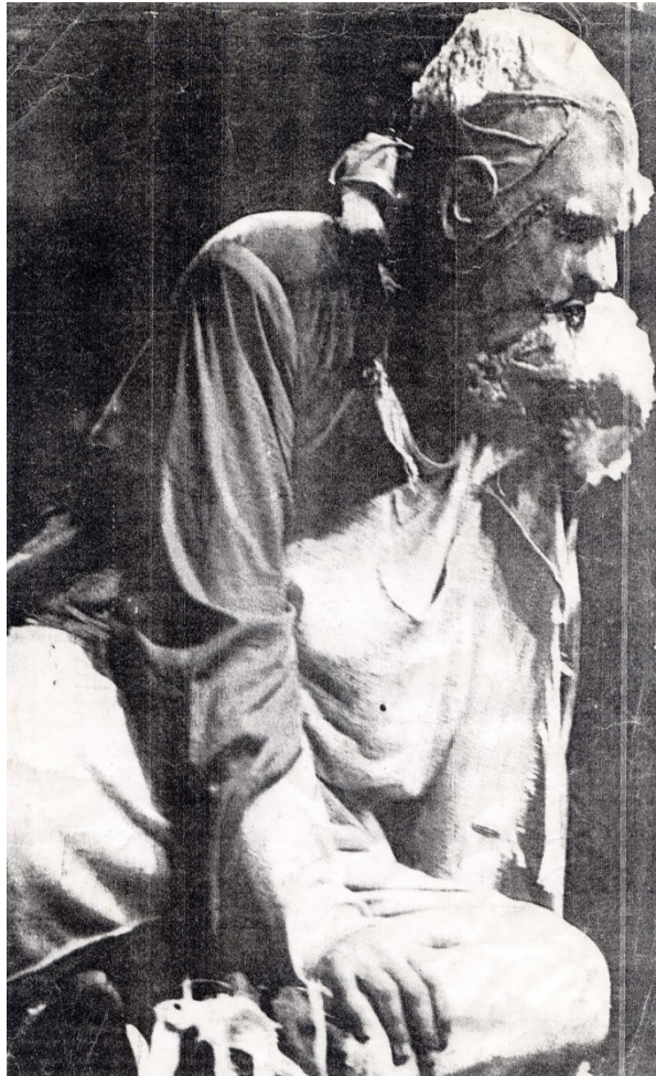
Figura 3 – Máscara de Eras, de Heiner Müller

http://asascenograficas.blogspot.com/p/mascaras-e-bonecos.html