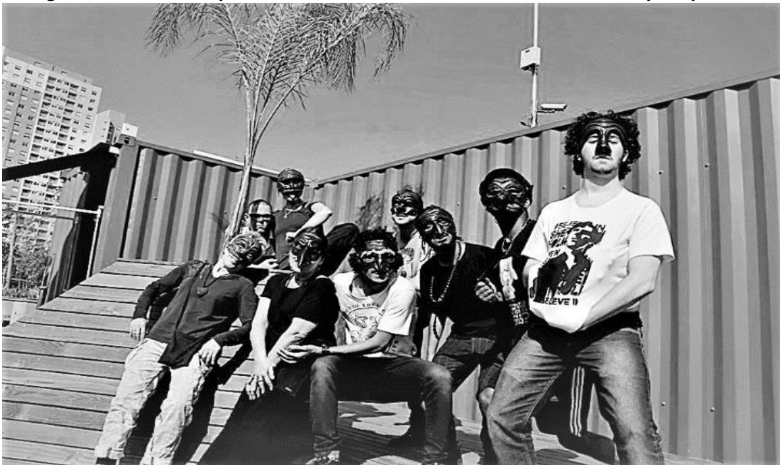
Figura 6 – Máscaras inspiradas na commedia dell'arte - SESC D. Pedro- SP

Sem a imaginação não podemos transcender nem improvisar. Lecoq (2010) parte de procedimentos que procuram resgatar esse estado do “ludismo infantil” ao imaginário, através do jogo, da improvisação. Assim, a improvisação presentifica a espontaneidade corporal e alcança o frescor da liberdade experimentada na infância, na fugacidade do brincar. Encoraja o corpo atuante a vasculhar o espaço interno, externo, observar o outro, errar, acertar, cair levantar, etc. como uma divertida brincadeira infantil “um bem-achado” de valor.