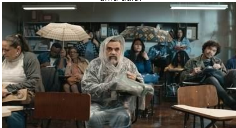
Foto 3: A sala com goteiras e os guarda-chuvas necessários para se assistir a uma aula.