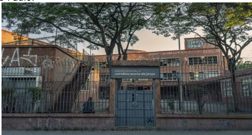
Foto 2: A série foi gravada entre julho e agosto de 2019 na antiga Escola do Jockey Clube de São Paulo.