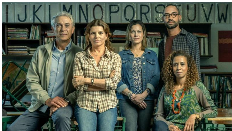
Foto 1: Da esquerda para direita, o diretor Jaci (Paulo Gorgulho), as professoras de Português, Lúcia (Débora Bloch); de História, Sônia (Hermila Guedes); de Matemática, Eliete (Thalita Carauta); e o professor de Artes, Marco (Silvio Guindane).