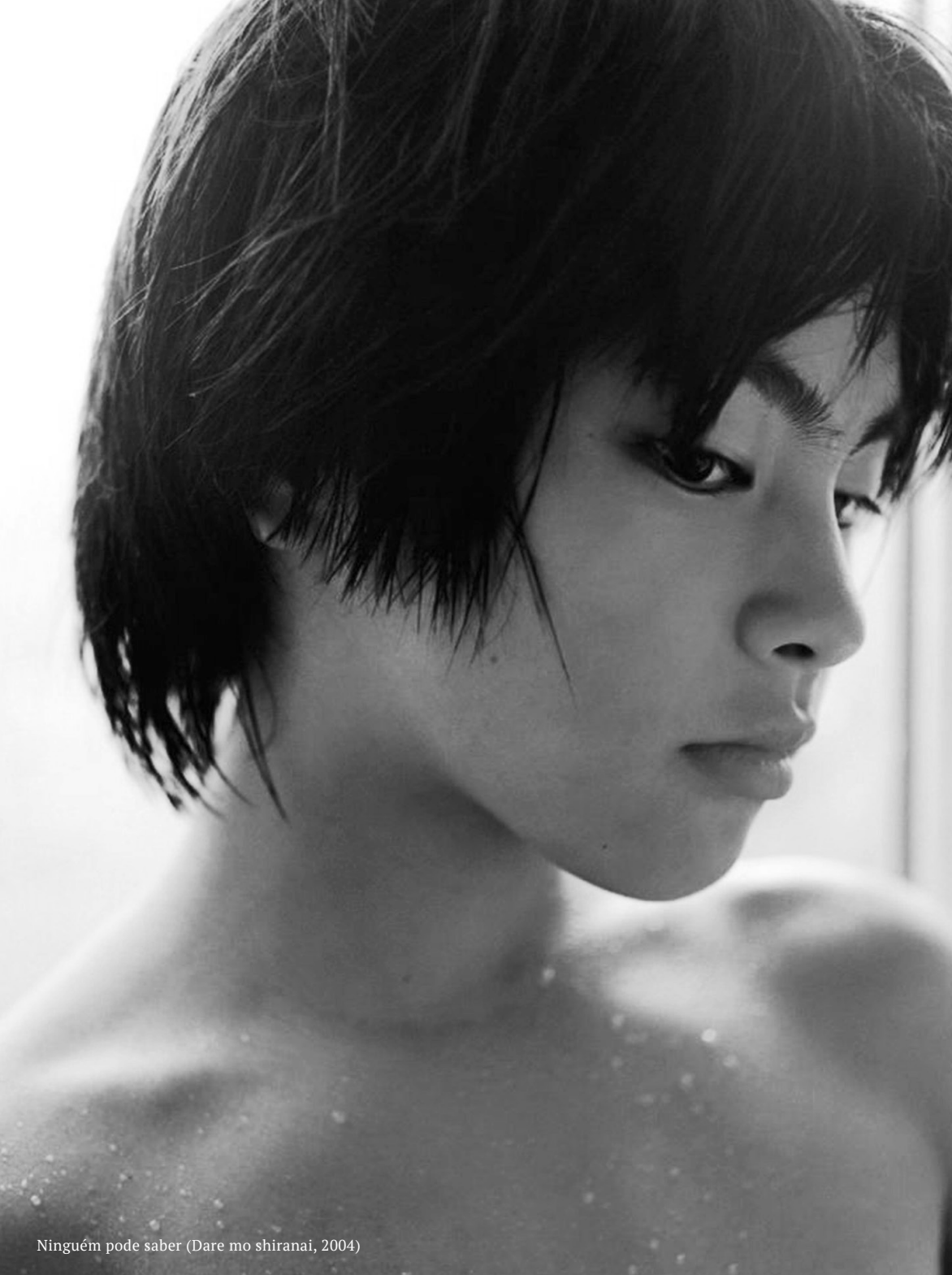
Ninguém pode saber (Dare mo shiranai, 2004)