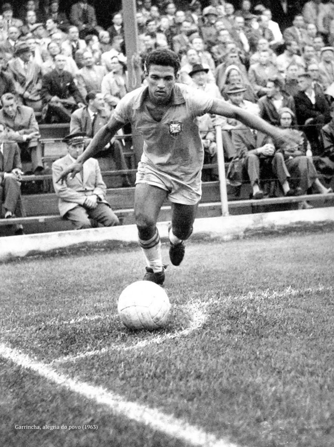
Garrincha, alegria do povo (1963)