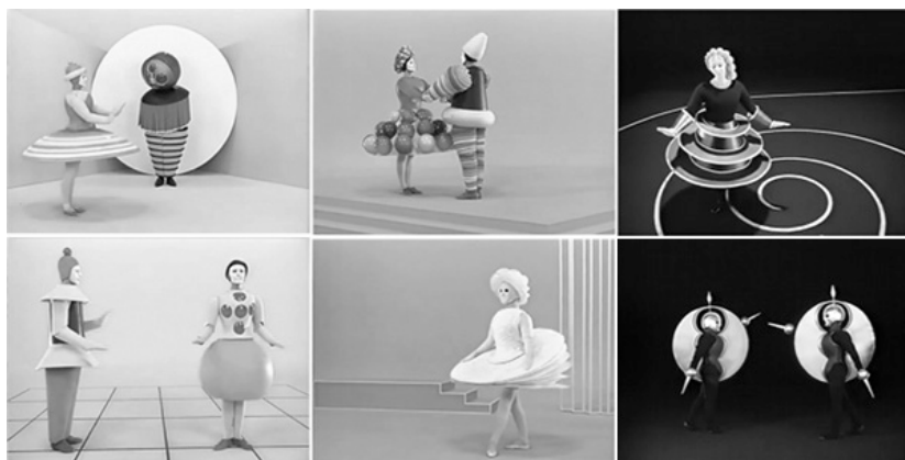
Fig 1 – Alguns momentos da reconstituição do Balé Triádico (Das triadische Ballett), a partir da obra de Oskar Schlemmer, realizada para a televisão alemã em 1970.

é primeiramente uma estrutura de números e medidas, uma abstração no sentido de um contrário, senão de uma oposição, à natureza [...] Da geometria do solo, da sucessão de linhas retas, de diagonais, do círculo e das curvas surge quase de si mesma uma estereometria do espaço pela verticalidade da figura dançante em movimento. Se representamos o espaço preenchido por uma massa plástica e mole, na qual as etapas do movimento do dançarino se solidificam como formas negativas, evidenciamos a relação imediata entre a planimetria do solo e a estereometria do espaço. O próprio corpo pode explicitar sua matemática ao desencadear sua mecânica corporal. 15