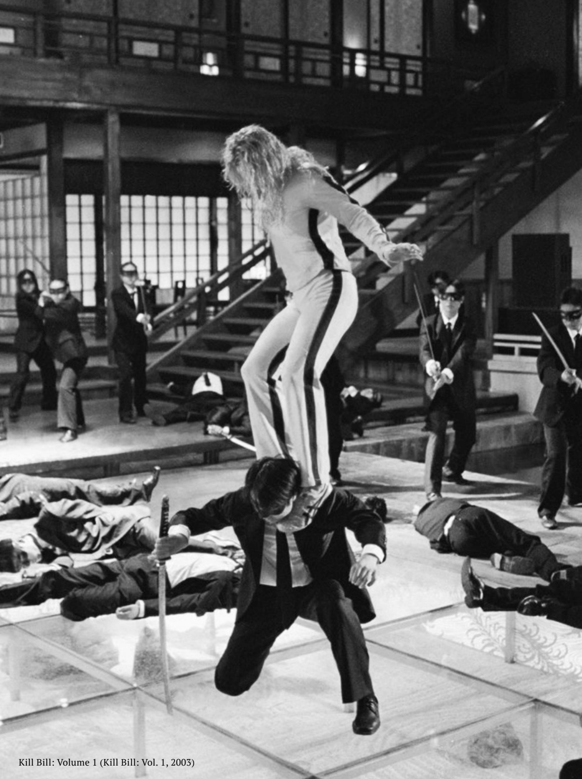
Kill Bill: Volume 1 (Kill Bill: Vol. 1, 2003)