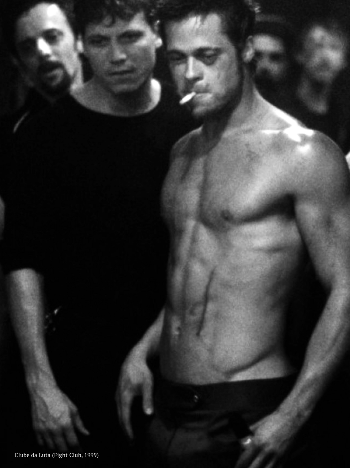
Clube da Luta (Fight Club, 1999)