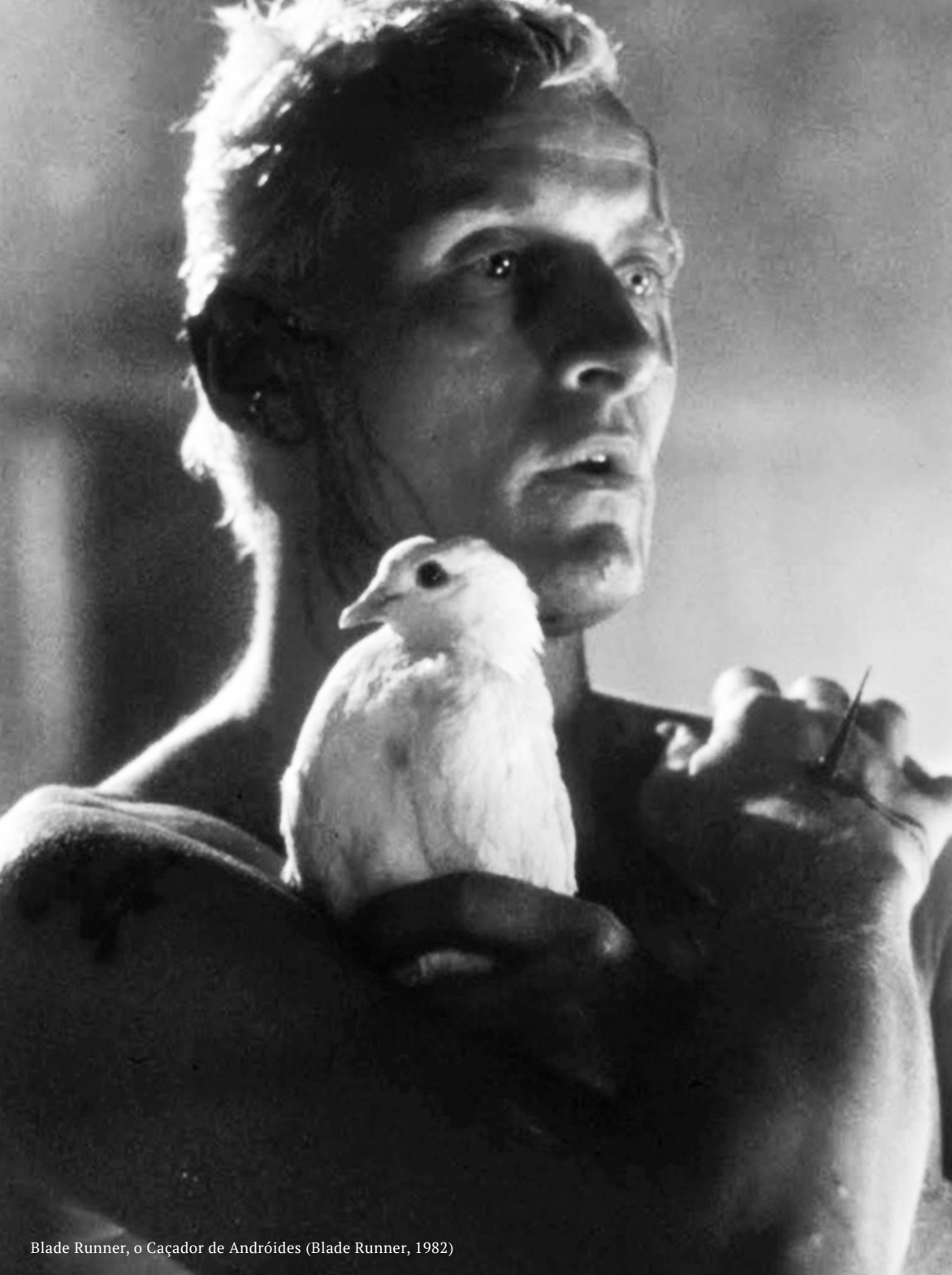
Blade Runner, o Caçador de Andróides (Blade Runner, 1982)