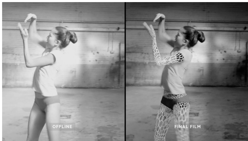
Fig. 2 – Imagem do clipe da música Wide Open , dos Chemical Brothers, antes e depois de adicionados os efeitos digitais de pós-produção.