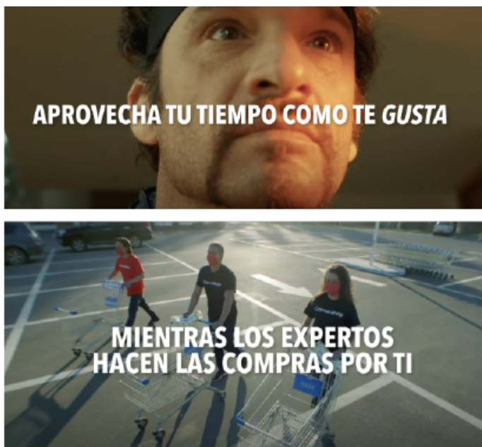
Figura 7 e 8 - Frames de vídeo publicitário Cornershop by Uber

“Aproveite seu tempo como gosta enquanto os especialistas fazem as compras por você” - Comercial do aplicativo de compras online “Cornershop by Uber”, 07 de dezembro de 2020, Colômbia. Disponível em Cornershop: Mercado como si tú lo hicieras