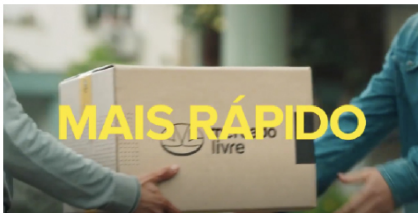
“Envio mais rápido do Brasil” - Comercial do Mercado Livre, 30 de janeiro de 2022, Brasil. Disponível em Mercado livre Envio mais rápido do Brasil no Mercado Livre