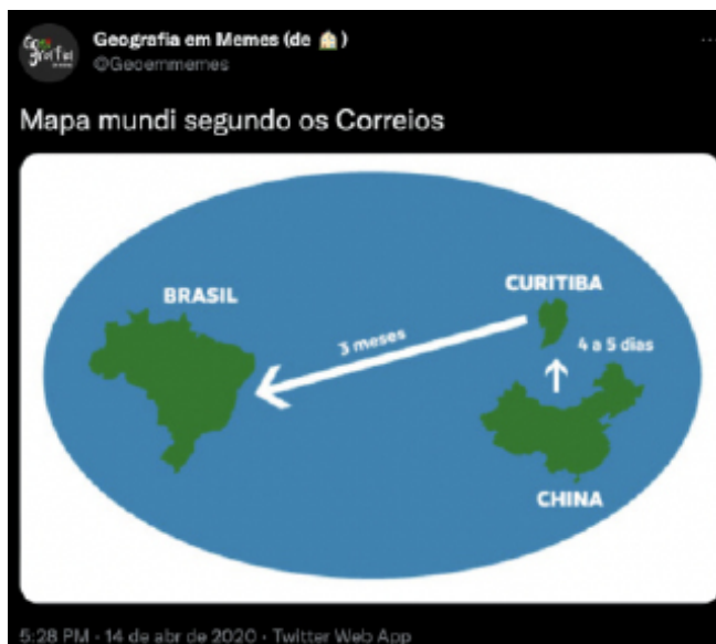
Figura 6 - Imagem do meme “Mapa Mundi segundo os Correios”

Meme brincando com o tempo de espera na logística internacional.