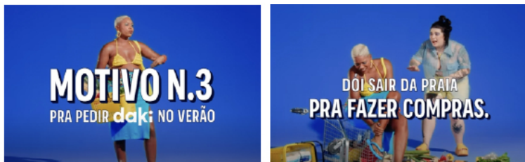
Motivo número 3 para pedir Daki no verão: dói sair da praia pra fazer compras - Comercial do aplicativo de supermercados Daki, 09 de fevereiro de 2022, Brasil. Disponível em Motivo N°3 para pedir Daki no verão

Fica claro que esses hábitos que podem ser entendidos como rituais de espera na vida para o capital facilmente acabam por ser preenchidos por outras atividades do cotidiano urbano. As esperas de fretes mais longas poderiam se tornar, para os mais adaptados, excitantes expectativas pelo recebimento do produto. Uma romântica representação do frio na barriga antes de um encontro com algo esperado. Porém, esta dimensão é pouco provável. Há a necessidade implícita e ansiosa de receber mais rápido, de forma eficaz. Nenhum tempo pode ser gasto, apenas no máximo economizado. Mas o grande paradoxo de todo esse processo até agora demonstrado é que, no afã de se economizar tempo, acaba-se por hiperutilizá-lo. Diante das demandas imperativas do capital o tempo livre não pode ser guardado ou utilizado para o sujeito em nenhuma instância fora do que demanda o capital. Tempo é dinheiro e sob o realismo capitalista, nenhum segundo pode deixar de ser explorado em nome do lucro.