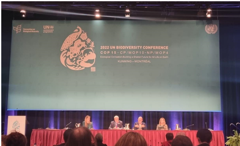
Figura 2. Negociações do Marco Global da Biodiversidade durante a COP 15 em Montréal em dezembro de 2022.

Os debates sobre a mobilização de recursos para a conservação da biodiversidade foram centrais nessa COP. O texto final do documento traz em sua meta 19 um conjunto de medidas que as partes se comprometeram a adotar para um aumento substancial de recursos de diferentes fontes. A meta também menciona o fomento às estruturas inovadoras como fundos de impacto, títulos verdes ( green bonds ) e créditos de biodiversidade.