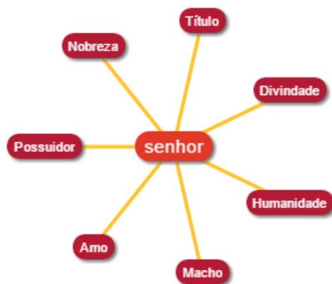
FIGURA 1 – Rede semântica da palavra senhor