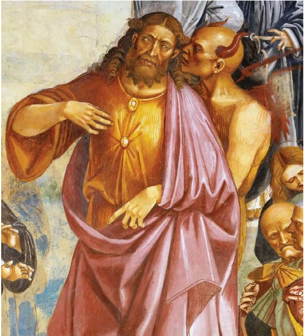
Imagem 2: Detalhe de La predicazione dell'Anticristo (c. 1500-1504), de Luca Signorelli (c. 1441-1523). Afresco, 13,7 x 12 m, Capela de São Brício , Catedral de Orvieto, Úmbria, Itália.