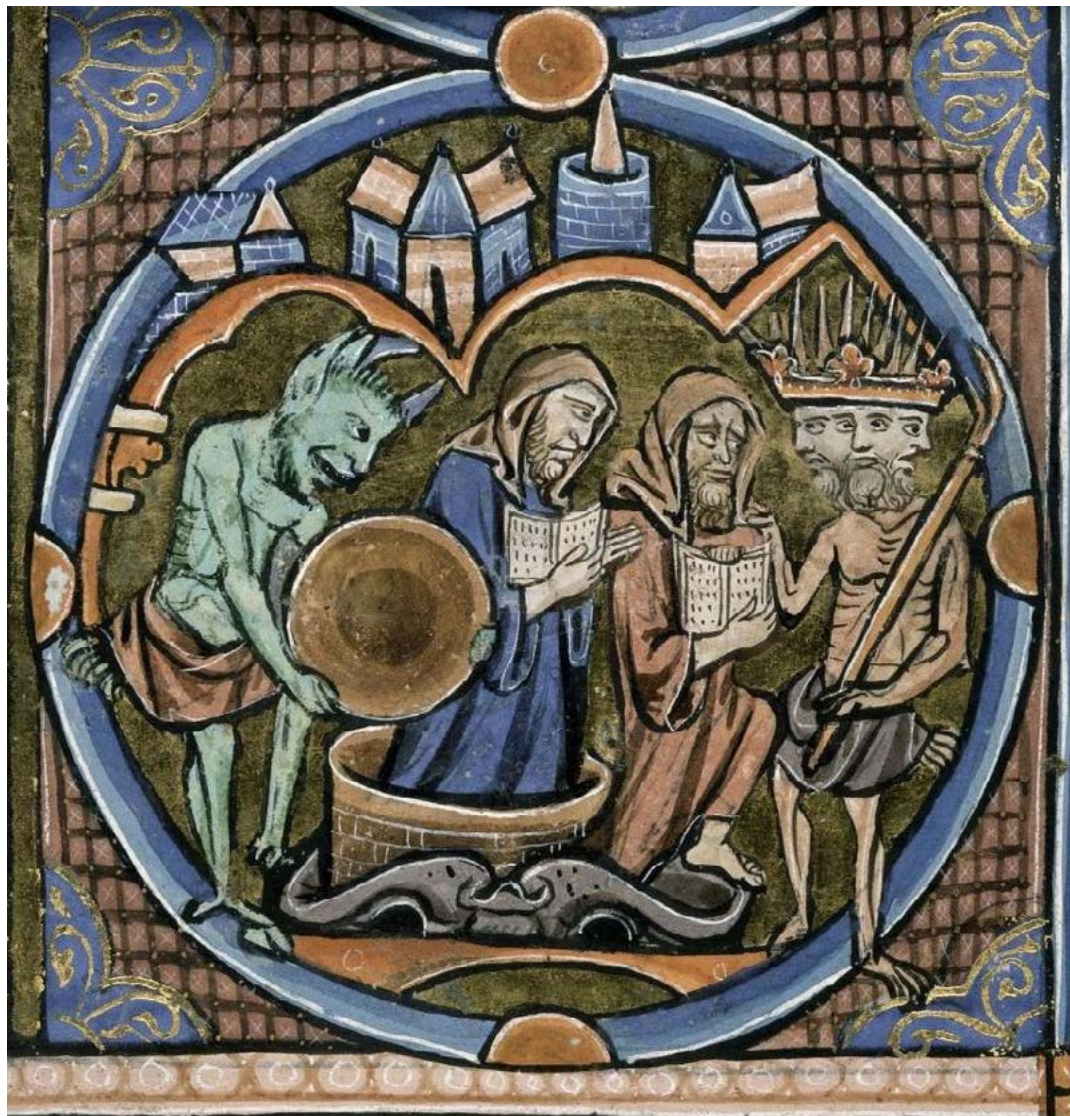
Imagem 8: Detalhe da rodela inferior na coluna da direita do folio , com o Diabo (à esquerda), possivelmente o Anticristo como Janus (só que não bifronte, como de hábito, mas com três faces), e dois homens com livros abertos, um dos quais dentro de um tonel. Bíblia Moralizada (séc. XIII), iluminura, Harley 1527, British Library, folio 127 .