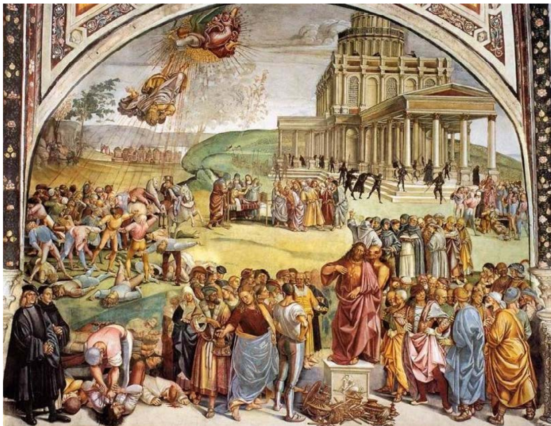
Imagem 1: La predicazione dell'Anticristo (c. 1500-1504), de Luca Signorelli (c. 1441-1523). Afresco, 13,7 x 12 m, Capela de São Brício, Capela de São Brício , Úmbria, Itália. 38

Nessa que é considerada uma de suas obras-primas, Signorelli registrou o tema da pregação do Anticristo (com o auxílio de mestres em Teologia, naturalmente). 39