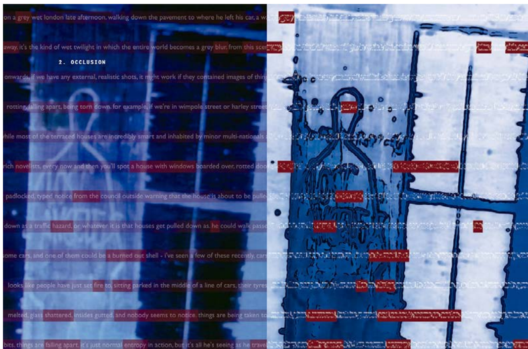
Fig. 5: Abertura do capítulo 2. “Oclusão”, de Sinal e Ruído . Fonte: GAIMAN; MCKEAN, 2011, p. 26-27.

No intervalo entre os capítulos de Sinal e Ruído , há páginas duplas com texturas coloridas ao fundo e textos aleatórios gerados por meio de um antigo programa de computador chamado Babble 2.0. Enquanto esse programa apenas embaralhava textos inseridos previamente, em 2020 a empresa OpenAI lançou o GPT, sigla para Generative Pretrained Transformer , que é um sistema de produção de textos baseado em machine learning e no conceito de rede neural alimentada por algoritmos. Esse programa foi usado pelo jornal The Guardian para escrever um artigo “enviesado” sobre como a IA pode ser inofensiva para os seres humanos 14 . Ainda em 2020, a Microsoft apresentou o Turing Natural Language Generation (T-NLG), que teve um desempenho melhor do que qualquer outro modelo de linguagem em uma variedade de tarefas, como resumir textos e responder a perguntas 15 .