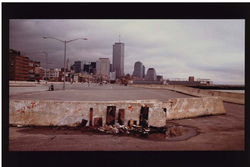
Fig. 4: Island within an Island , Gabriel Orozco, 1993.

sentido que podemos compreender, por exemplo, a fotografia Island within an Island [Ilha dentro de uma ilha], feita pelo artista mexicano Gabriel Orozco em 1993 (Fig. 2). No primeiro plano da composição, vemos alguns entulhos dispostos de maneira a mimetizar os prédios ao fundo, característicos da cidade de Nova York, e dentre os quais estão as Torres Gêmeas. Depois dos acontecimentos do dia 11 de setembro de 2001, essa fotografia adquiriu um novo significado, não somente como imagem de uma lembrança, mas também de um vir-depois e de um prenúncio insinuado pelo céu carregado de nuvens contraposto aos pequenos escombros no asfalto.