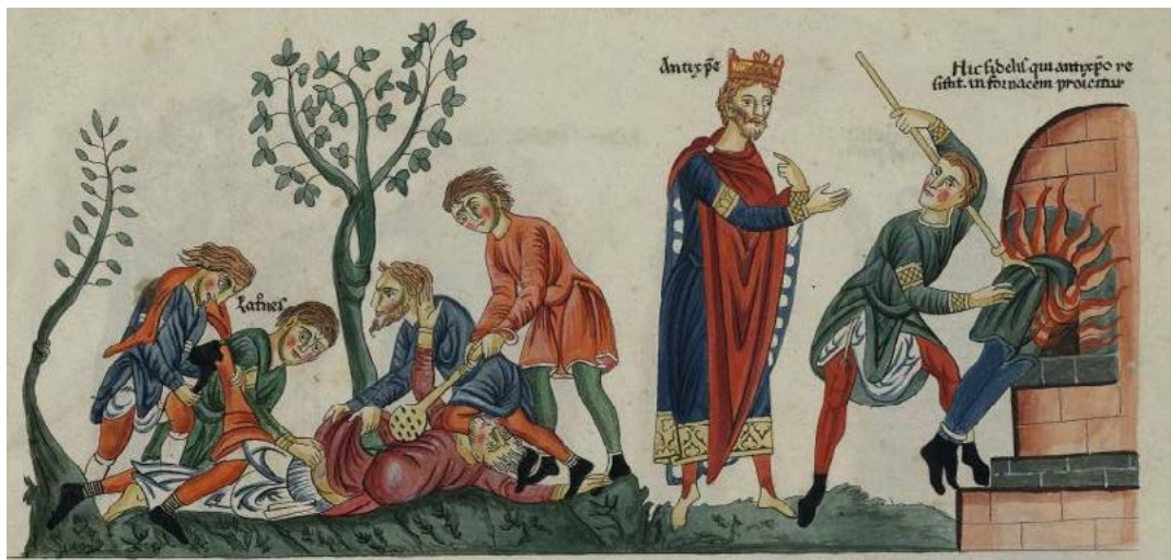
Imagem 3: Detalhe de ENGELHARDT, Christian Maurice (1775-1858). Herrada de Landsberg (1125-1195). Hortus deliciarum (1167-1185). Stuttgart und Tübingen, 1818, BnF Gallica , folio 5 . Da esquerda para a direita: 1) trecho da Parábola do Bom Samaritano (segunda cena: no caminho, o homem caiu nas mãos de bandidos que, tendo-o despido e coberto de feridas, foram embora deixando-o meio morto; 2) o Anticristo (representado como um rei): acima da cena, pode-se ler que os que resistirem a ele, serão jogados no forno. 51

Provavelmente, por ter sido escrita como uma biografia (espécie de espelho invertido do Cristo!), o texto de Adso se tornou modelo para as hagiografias posteriores 49 e para as alusões ao Anticristo, como a história da salvação contida no Hortus Deliciarum (1167-1185) da abadessa Herrada de Landsberg (1125-1195) (imagem 3). 50