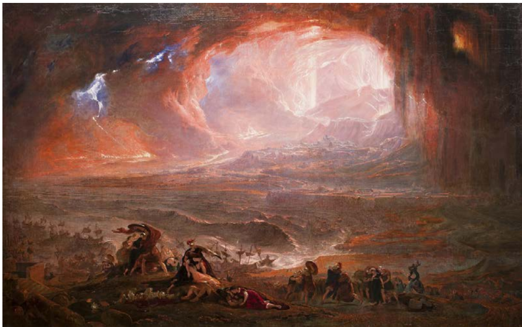
Fig. 1: Versão restaurada da obra The Destruction of Pompeii and Herculaneum , de John Martin, pintada em 1822, danificada em 1928 e restaurada em 2011.

Para precisar tal problemática, um breve fato histórico mostra-se pertinente. Em 1928 3 , o rio Tâmisia transbordou e o centro de Londres inundou. 14 pessoas morreram e milhares ficaram desabrigadas. A parede em frente ao museu Tate Britain desabou. O porão e as novas galerias do andar térreo foram completamente preenchidos de água, 18 obras de arte foram consideradas irrecuperáveis, outras 226 seriamente danificadas, e 67 levemente afetadas 4 . Entre as pinturas submersas estava The Destruction of Pompeii and Herculaneum , do artista John Martin (1822, Fig. 1). A obra residia nos arquivos no porão da Tate desde 1918, pois o artista havia saído de moda algumas décadas depois de ter sido aclamado pelo público vitoriano. Uma vez resgatada da inundação, a tela foi enrolada, guardada e novamente esquecida até sua redescoberta em 1973 e sua restauração em 2011.