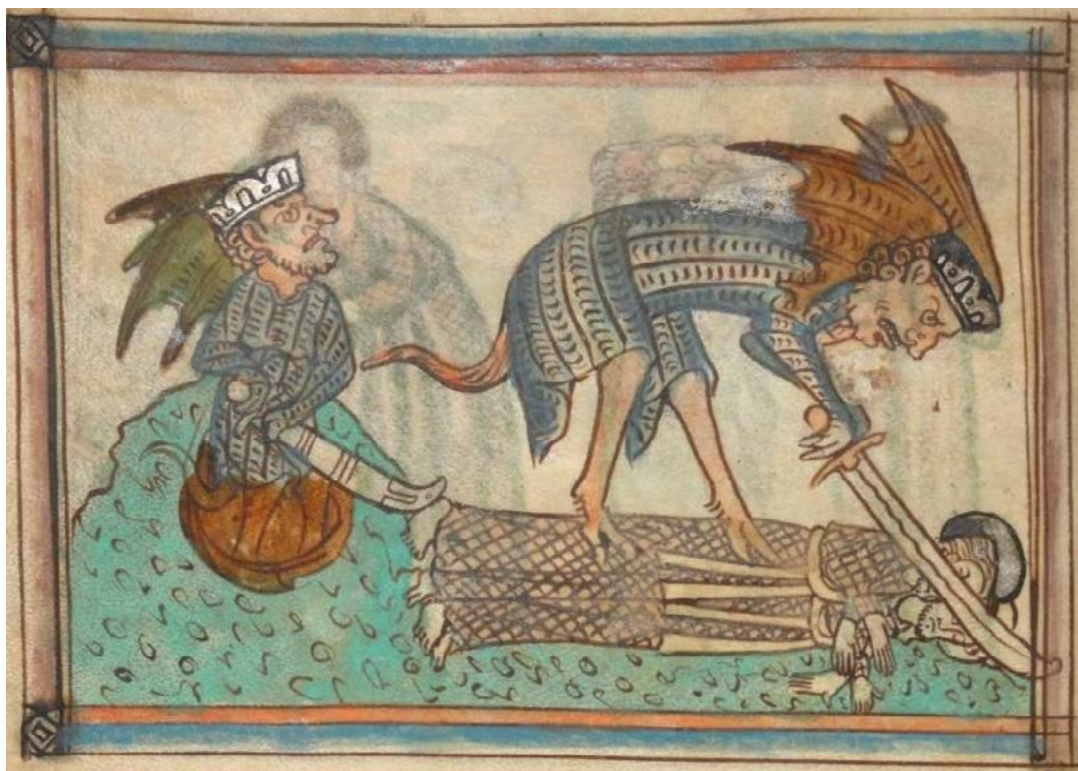
Imagem 7: O Anticristo assassina duas testemunhas (Ap 11, 7: A morte das testemunhas ). Apocalipse em latim e anglo-normando francês (início do séc. XIV), Royal MS 2 D XIII, folio 23v.

Jesus Cristo quis, pacientemente , sofrer prostrações muito graves e uma morte angustiante. 96 Como o Anticristo é seu exato oposto, espelho invertido, matará impacientemente os homens que se opuserem e não acreditarem nele. 97 E ameaçará tão terrivelmente a todos que tirará deles a caridade e multiplicará o temor sobre a caridade e a justiça. 98